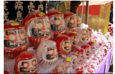
액막이 원삼대사 대축제 '달마 시장'